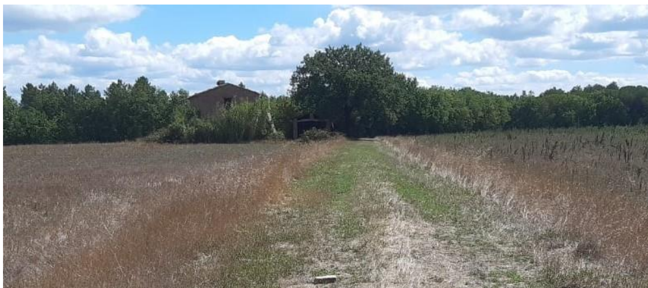
Figura 4. Visuale panoramica dell'immobile oggetto dell'intervento dalla strada di accesso ( cono 3 ).