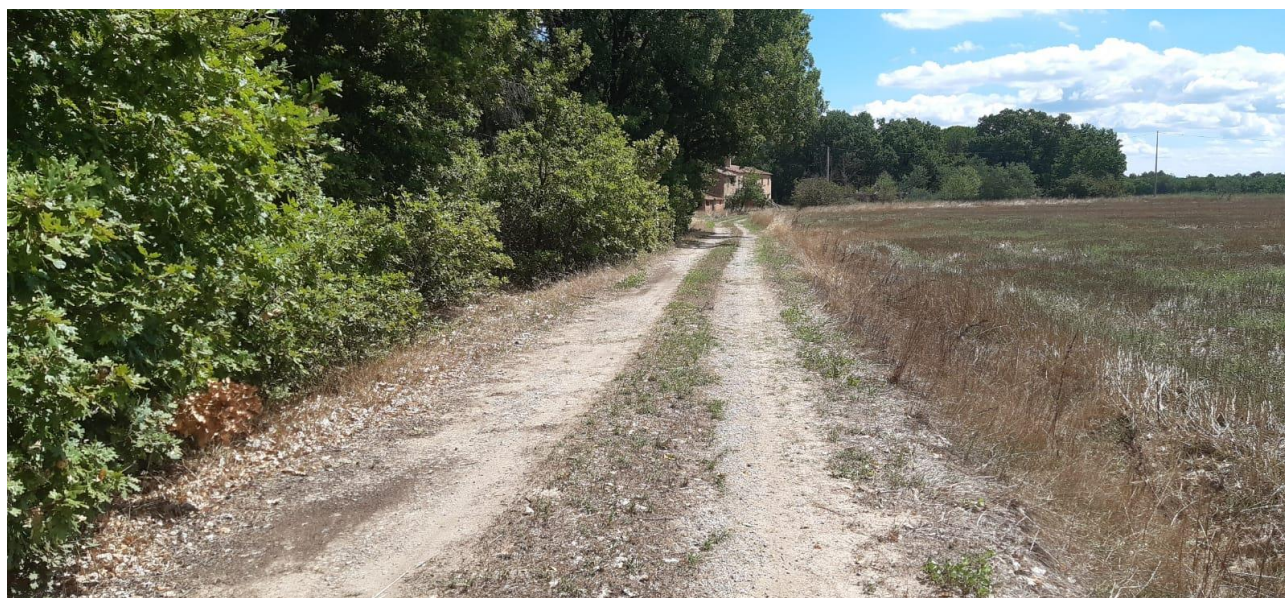
Figura 2. Prospettiva della strada di accesso alla proprietà (cono 1).