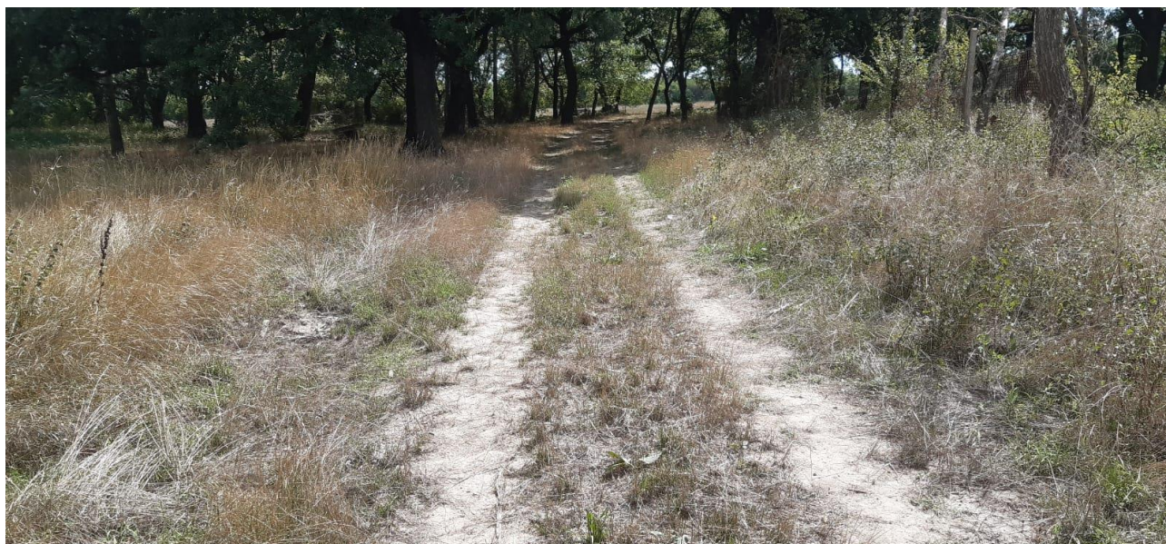
Figura 3. Prospettiva della strada di accesso alla proprietà (tratto habitat 91Mo) ( cono 2 ).