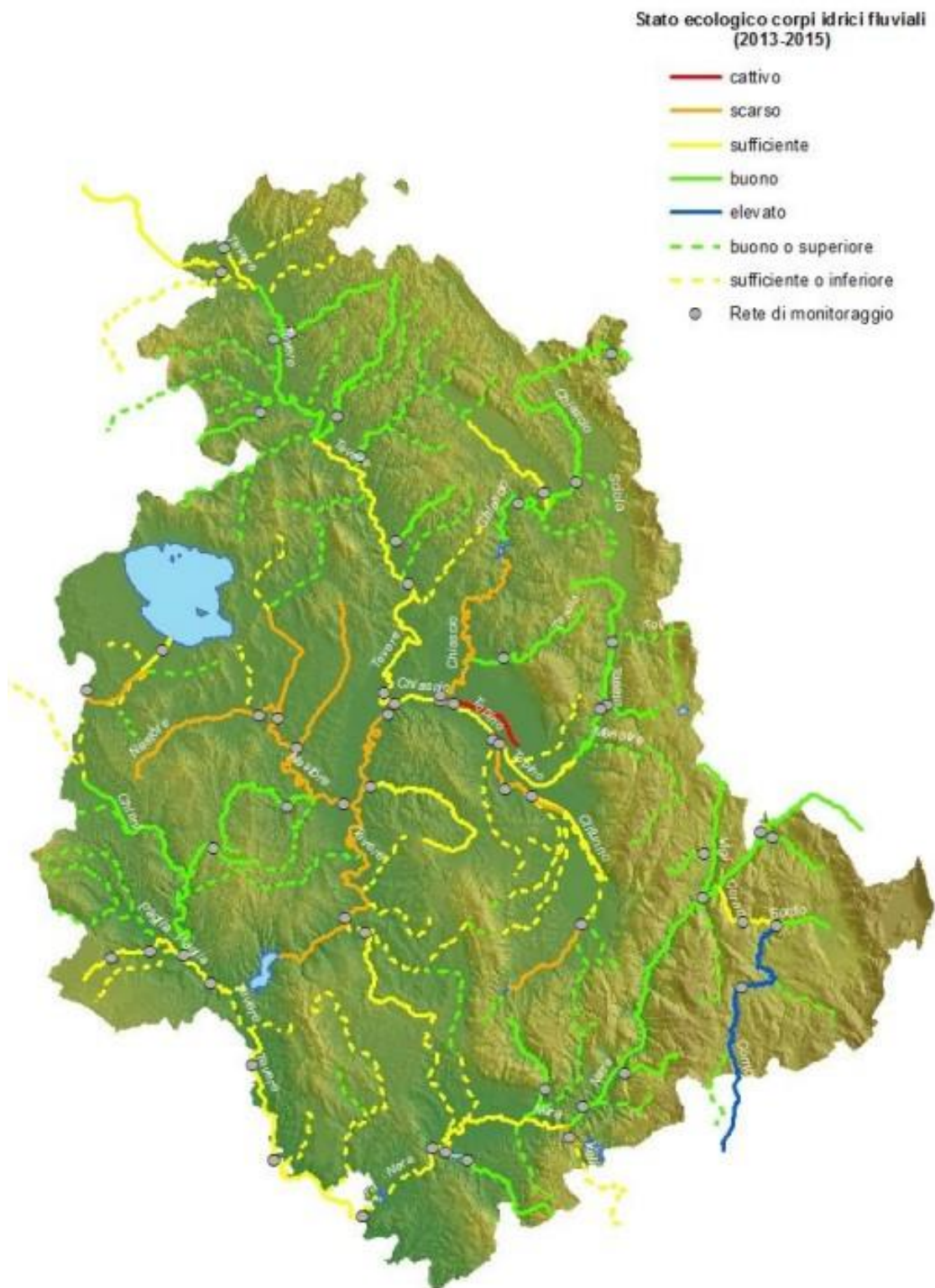
Figura 4. I corpi idrici e lo stato ecologico