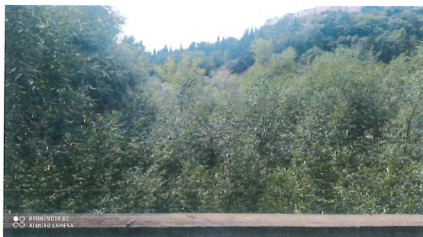
Tratto a valle della passerella pedonale

Importo complessivo progetto: € 100.000,00