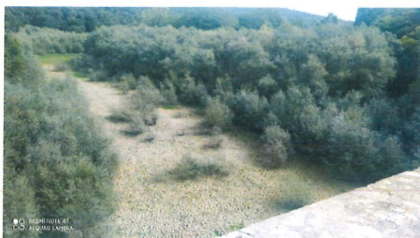
Tratto a monte della S.S.205