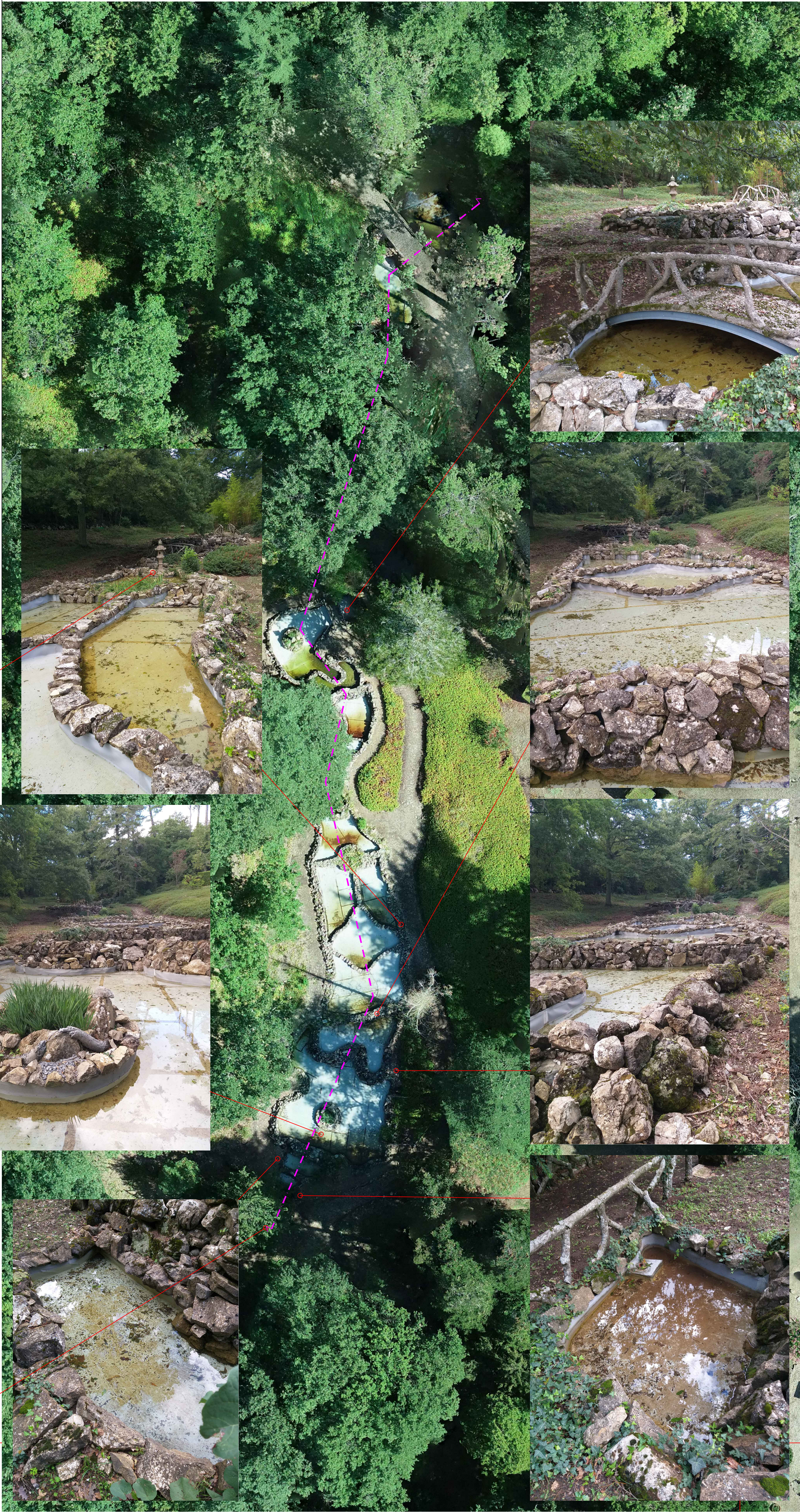
ORTOFOTO - RIPRESA SAPR (DRONE) - SCALA 1:200