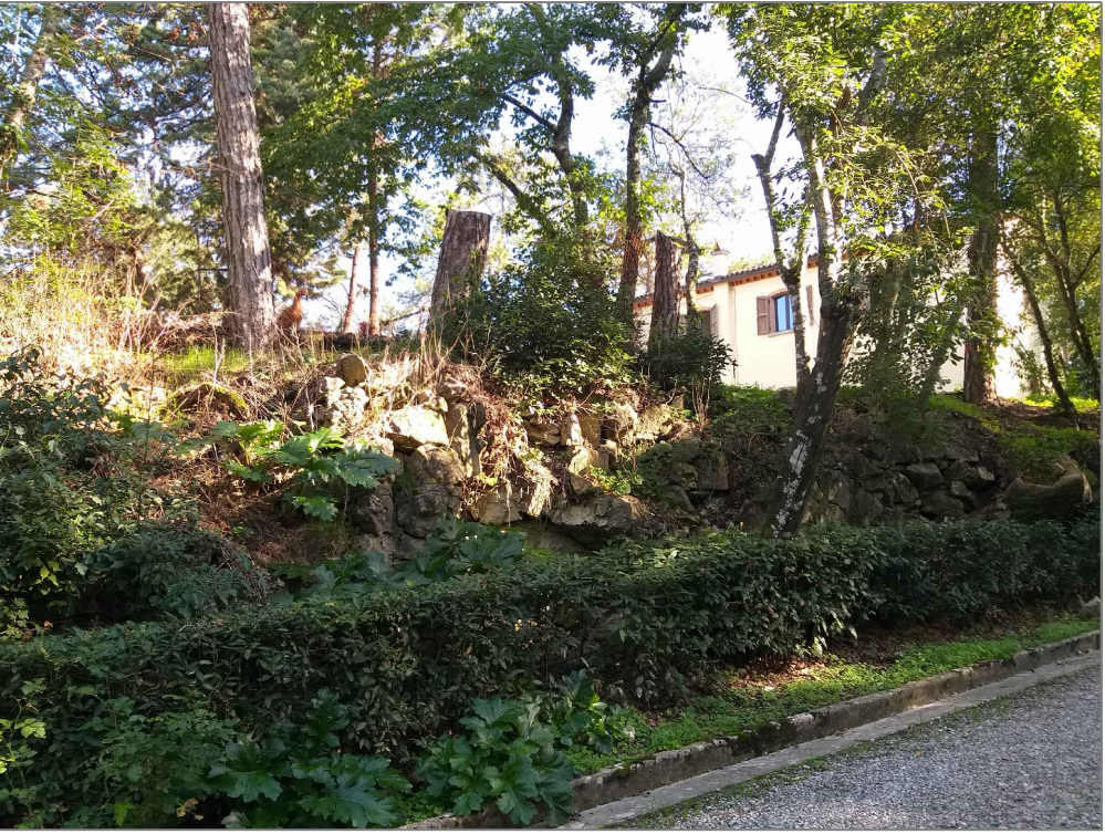
FOTO B - DISLIVELLO STRADA - PIANO EDIFICIO = ML. 4.50 DISLIVELLO STRADA - LINEA DI GRONDA = ML. 10.50