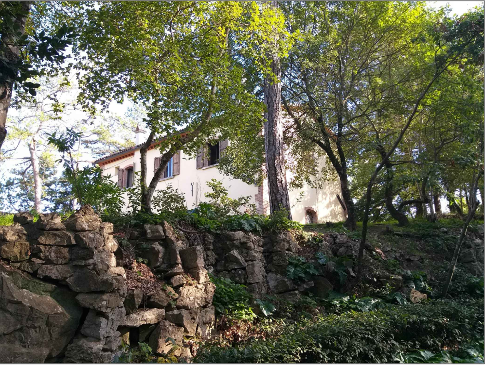
FOTO A - DISLIVELLO STRADA - PIANO EDIFICIO = ML. 3.00 DISLIVELLO STRADA - LINEA DI GRONDA = ML. 9.00